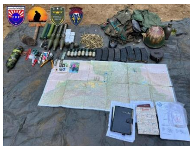
Explosives and military equipment left behind by retreating soldiers in Myawaddy Township, Karen State on Monday.

Six junta troops were killed and 14 injured in intense clashes with a combined force of Karen National Liberation Army (KNLA) and PDF groups in Myawaddy Township, Karen State on Sunday and Monday, said the KNLA's Cobra Column on Tuesday.