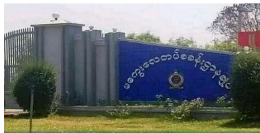
A junta air base in Magwe Region

A junta air base in Magwe Township, Magwe Region was shelled by combined resistance groups on Tuesday morning, said PDF group Golden Eagle Myaylatt, which was involved in the attack.