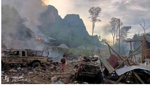
Burned out trucks at the mine near Payathonzu town, Kayin State on Nov. 16, 2022.

The identity of the victims is not yet known but they are believed to be workers at an antimony (kohl) mine, which is about 32 kilometers (20 miles) from Payathonzu town in Kayin State.