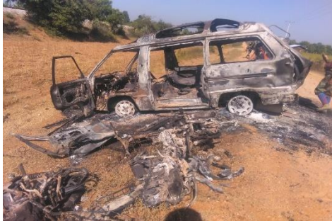
A vehicle destroyed in an arson attack by junta troops

Two days earlier, the military launched a series of airstrikes between the villages of Si Thar Myay and Lein Taw in Ye-U Township, about 80km northwest of Wetlet, using two Mi-35 attack helicopters, according to local resistance sources. Two Mi-17 transport helicopters were also used to airlift soldiers into the area, they added.