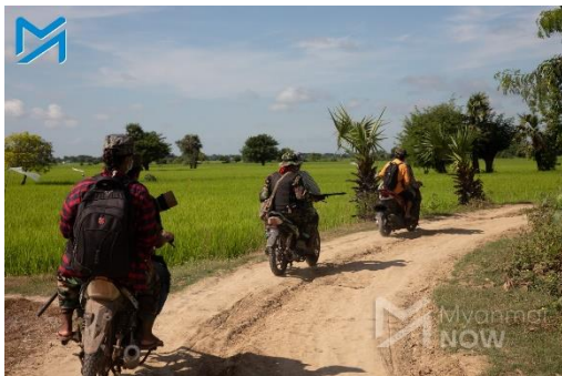
Members of a local defence team in Sagaing

All three had bullet wounds in their heads, the source said.