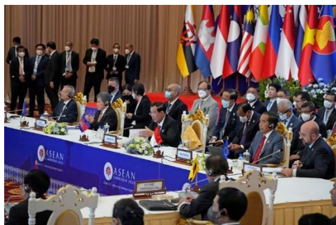
Cambodia's Prime Minister Hun Sen [center] speaks at the ASEAN meeting in Phnom Penh, Cambodia, Nov. 13, 2022.

ASEAN's statement, which warned of a "final decision" on the Myanmar issue if the junta failed to meet its obligations on the Five Point Consensus within an agreed upon timeline, also reserved the bloc's right to review the country's representation at its meetings based on compliance.