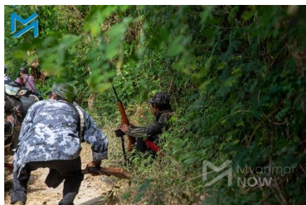
Members of a local defence team prepare to ambush a junta column in Sagaing Region on November 18

"Some of our members went back in, but they were ambushed and some of them were injured. Two went completely radio silent," he said.