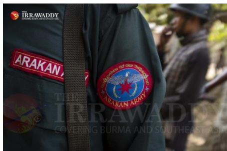
AA ညာလက်မောင်းတံဆိပ်/ဧရာဝတီ

ဂျပန် နိပုန်းမေင်ဒေးရှင်း၏ အကူအညီ ဆန်အိတ်များကိုလည်း ပို့ဆောင်ခွင့်ပိတ်ထားရာ အောက်တိုဘာလတွင်မှ ဒုက္ခသည်တဦးလျင် ဆန်တအိတ်နှုန်း ခွင့်ပြုခဲ့၍ စစ်ဘေးဒုက္ခသည်များ အတန်ငယ် အသက်ရှူချောင်ခဲ့၏။ ဂျပန် အကူအညီ ဆန်အိတ်များကို ကြာရှည်စွာ တားမြစ်ထား၍ ပိုဒေါင်တွင်းရှိ ဆန်အိတ်အချို့ ပျက်စီးမှုပင် ရှိခဲ့သည်။