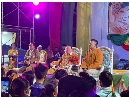
RCSS ဥက္ကဋ္ဌ ဗိုလ်မှူးကြီး ယွက်စစ်

သျှမ်းလူထုများအနေဖြင့် တစ်ဦးနှင့် တစ်ဦး အမုန်းစကားမပွားကြရန် အပြစ်တင်မီးမှောင်းထိုးမပြောရန် သျှမ်းပြည်ပြန်လည် ထူးထောင်ရေးကောင်စီ ၊ သျှမ်းပြည်တပ်မတော် RCSS/SSA ဥက္ကဋ္ဌ ဗိုလ်ချုပ်ကြီး ယွက်စစ် ပြောကြားလိုက်သည်။