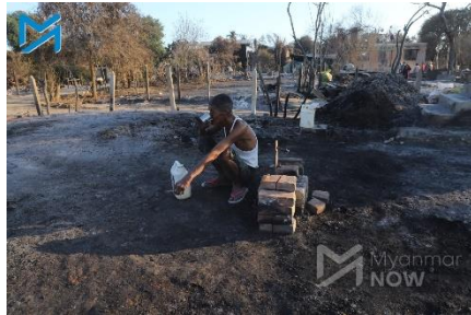
A villager sits among the ruins of a village in Sagaing Region's Khin-U Township on November 21