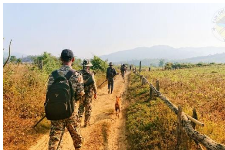
YDF troops pictured in mid-July

Three civilians and one guerrilla fighter were shot and killed by junta troops while fleeing a raid on Tuesday in the Yaw region of Magway, according to the leader of a local resistance force.