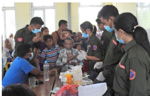
Medical officers from the AA vaccinate civilians for COVID-19 in Rathedaung Township in 2021, demonstrating the increased reach of its administration.