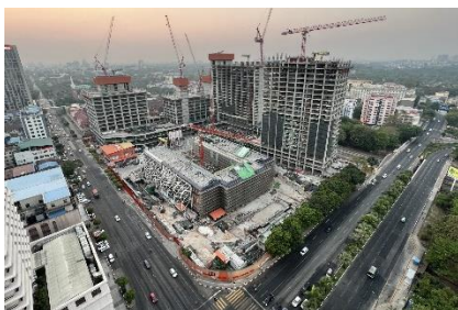
The construction site of the luxury Peninsula Yangon Hotel in downtown Yangon in March 2022

According to this formula, Myanmar's trade deficit of $25billion between 2011 and 2020 must have been balanced by foreign direct investment (FDI) or a financial account surplus of that amount as foreign currencies came into the country. Otherwise, Myanmar would have had a balance of payment crisis, as it had a perennial trade deficit.