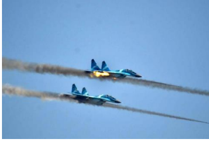
Two Myanmar military fighter jets are pictured during a training exercise (Cinco)

That morning, a clash had broken out between junta troops and the local People's Defence Force chapter at the site, 10 miles north of Htigyaing town. Locals claimed that five resistance fighters were injured, and that Myanmar army soldiers set fire to several homes in Ah Lel Taw and another