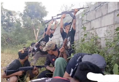
Members of the Young Revolution Front attacking the Kaing Lel police station on November 26 as part of a resistance alliance

“We were trying to get past the final bunker from which they were firing machine guns at us when a Mi-35 aircraft fired not just at the base, but also into the village and at the surrounding hills, so we had to retreat,” said