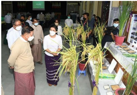
Regime chief Min Aung Hlaing meets with Department of Agriculture staff in Naypyitaw in June