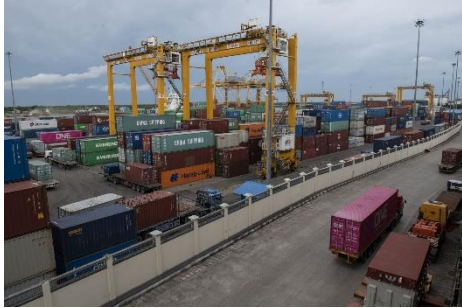
Shipping containers are seen at the Asia World Port in Yangon in May 2020

In its latest report on Myanmar, released in July, the World Bank estimated that the foreign reserves held by the Central Bank of Myanmar (CBM) fell nearly $1 billion in the quarter that ended in September 2021. It added that a nearly two-thirds decline in FDI compared to the previous year, as well as sharp reductions in other investment flows and substantial outflows of foreign currency deposits, were putting the country under mounting financial pressure.