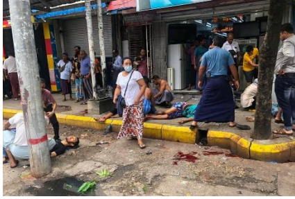
Passers-by help people injured after a bomb blast in central Yangon on May 31