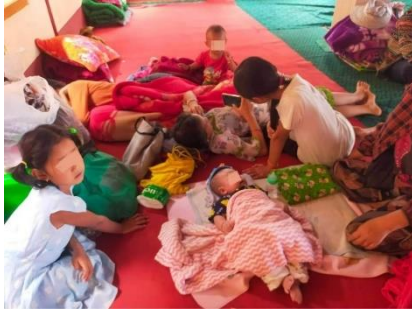
IDPs in Hsipaw township.

A volunteer, who also wished to remain anonymous, said that over 400 villagers are staying in churches, Maharsi and Bodaw Buddhist monasteries and with relatives in Hsipaw town. “The abbot has given them some food and shelter, but it’s not enough for everyone,” she told SHAN. Most of the people have fled from Ho Nawng, Kong Pin and Koong Hsar.