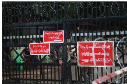
FILE - Police officers and prison personnel are seen behind the entrance gate of Insein prison in Yangon, Myanmar, Oct. 18, 2021.

They were brutally tortured in many ways, including beatings, cigarette burning, prolonged stress positions, and gender-based violence, according to the report.