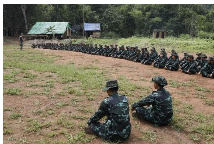
Members of the People’s Defence Force, armed wing of the parallel National Unity Government, taking part in training at a camp in Kayin State on October 6 last year.

“But we will never stop fighting,” he insists.