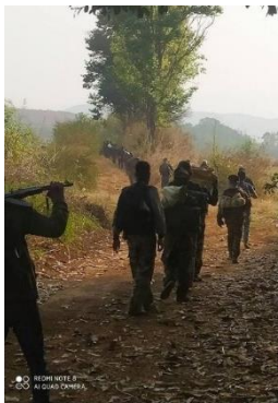
သျှမ်းမြောက် PDF

PSDA ကို စတင်ဖွဲ့စည်းချိန်က ဒေါနသံလွင် ဦးဆောင်ပြီး လွန်ခဲ့တဲ့ မတ်လက ဖြစ်ပွားတဲ့ တိုက်ပွဲကြောင့် ဒေါနသံလွင် ကျဆုံးသွားခဲ့ပါတယ်။ အဲ့နောက်ပိုင်းမှာ PSDA ရဲ့ ဒု ဗဟိုမှူးတာဝန်ခံ ရွှေလီက ရာထူးတက်လာပြီး PSDA ဦးဆောင်ပါတယ်။