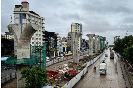
The Myanmar-Korea Friendship Bridge (Dala Bridge Project) in Yangon's Lanmadaw Township in August

His logic of equating a trade surplus with strong economic performance may show his economic illiteracy, or it might be his way of trying to cover up his mismanagement of the economy and the cost of his coup to the society at large. Either way, it does not bode well for the country's